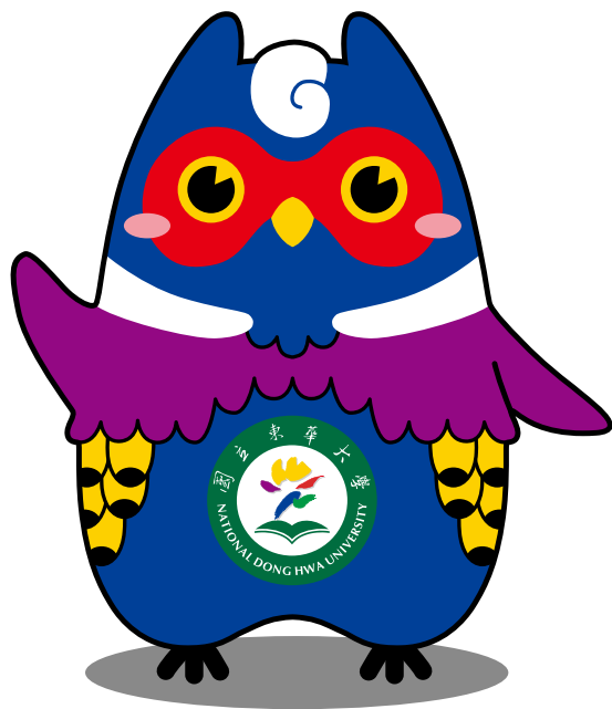
正面 / FRONT